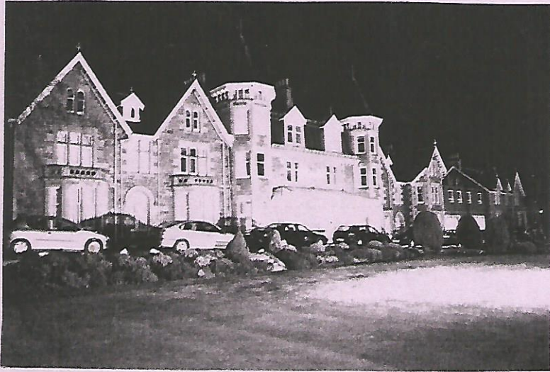
Le B&B de Granton-on-Spey