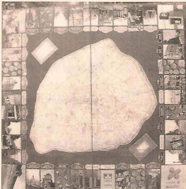
Monopoly offert aux Ecosais pour les dix ans de notre jumelage.