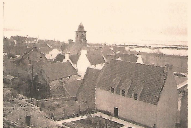
Port de Culross (Fife)

👂 Et bien sûr, pour nous choristes, des souvenirs musicaux : les cris d'encouragements aux rugbymen, la soirée « musique traditionnelle » au rugbyclub, le concert où nous avons été si chaleureusement accueillis dans l'église de Carnoustie sans oublier les jeunes danseuses des Highlands de la soirée d'adieu.