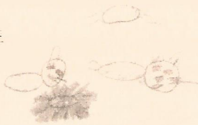
Détail du dessin de Marianne Rousselet.(7 ans)

Ce voyage en Ecosse était époustoufflant et passionnant. Avec ces châteaux et paysages magnifiques sans compter le terrain de golf de Carnoustie qui est le deuxième terrain de golf le plus difficile au monde.