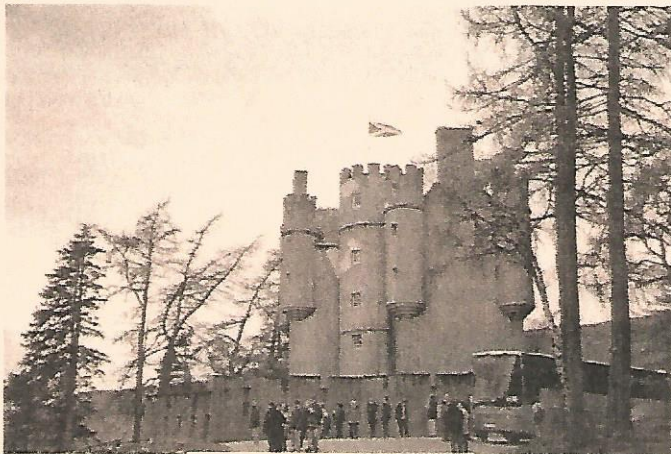
Château de Braemar.

👁 Souvenirs visuels : des cerfs s'égayant dans les collines, des châteaux, des torrents, des petits ports bucoliques.