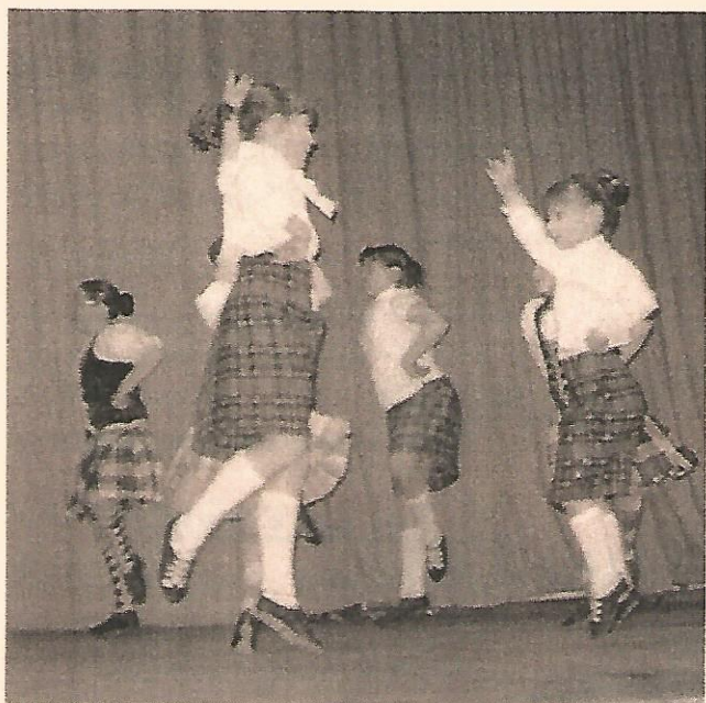
Jeunes danseuses écossaises.

Le mercredi soir fut pour les jeunes l'une des meilleures soirées. En effet, les plus jeunes comme les ados, parfois même plus âgés, étaient tous présents à la « Zone » (équivalent du P.I.J. à Carnoustie.) Karaoké, musique de tous genres, jeux vidéo, billard et baby-foot nous ont permis de passer une soirée inoubliable en compagnie de nos écossais. C'est ainsi que de 19 h