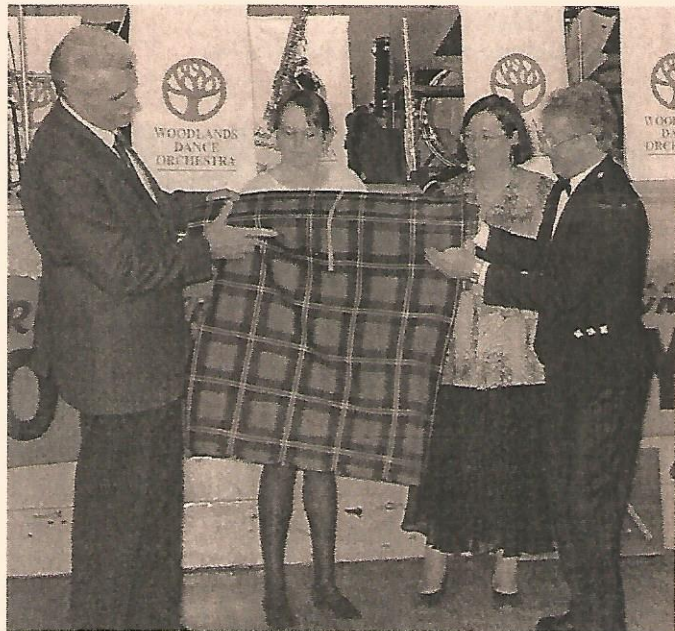
Tartan du CJMM présenté lors de la soirée d'adieu.