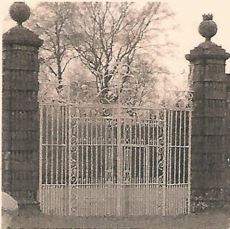
Le portail d'entrée du domaine de Panmure.